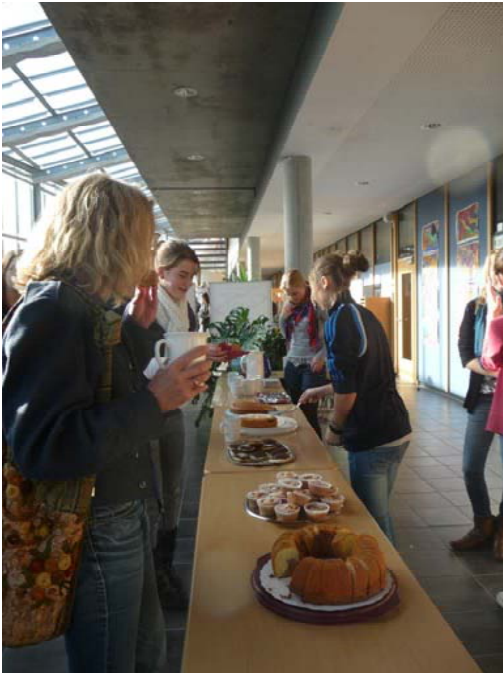
Schülerinnen und Schüler der Klasse 9a versorgten die Zehntklässler und die Experten in der Pause mit Kaffee und selbstgebacktem Kuchen.

Von Seiten der Experten wurden das Interesse und Engagement der Schüler was Berufsorientierung und Zukunftsplanung anbelangen wie auch die offene Atmosphäre geschätzt. Ebenso wurden die Freundlichkeit und Aufgewecktheit der Schüler hervorgehoben. Gelobt wurde zudem die Organisation und der zeitliche Ablauf. Insbesondere in den kleinen Gruppen von 5 bis 15 Schülern, besteht nach Meinung der Fachleute für die Schüler die Möglichkeit offen über Erwartungen und Probleme zu reden, sowie Fragen zu äußern. Als Pluspunkt wurde zudem erwähnt, dass die Schüler sich selbstständig, ihren Neigungen entsprechend, Experten aussuchen konnten. Aufgrund der positiven Erfahrung mit den PKG'ern boten die Fachleute Plätze fürs BOGY-Praktikum im nächsten Jahr an. So haben sowohl die Schüler als auch die Unternehmen von der Veranstaltung profitiert. Die Kooperation zwischen Schule und außerschulischen Partnern im Bereich Bildung hat sich also auf jeden Fall gelohnt.